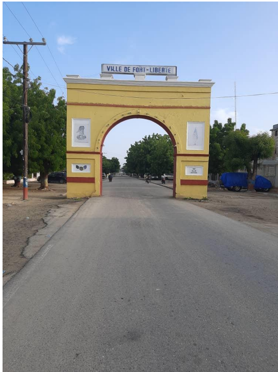
Entrée de la ville de Fort-liberté