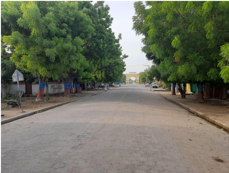
Rue stenio vincent